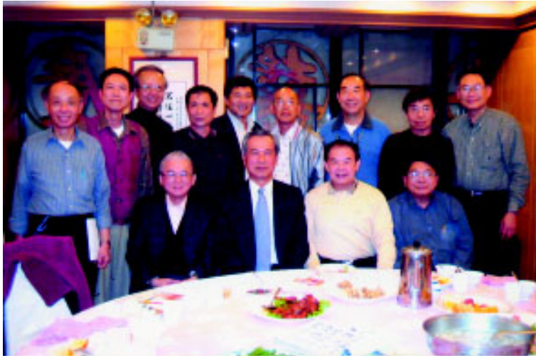
建中母校 47 年畢業高三 2 班舉行同學會並慶賀該班同學吳榮義（前排左 2）榮升行政院副院長。

五十年別離又相見。浮雲一別後，流水五十年，歡笑情如舊，蕭疏鬢已斑。（47/48 年畢業校友同學會）